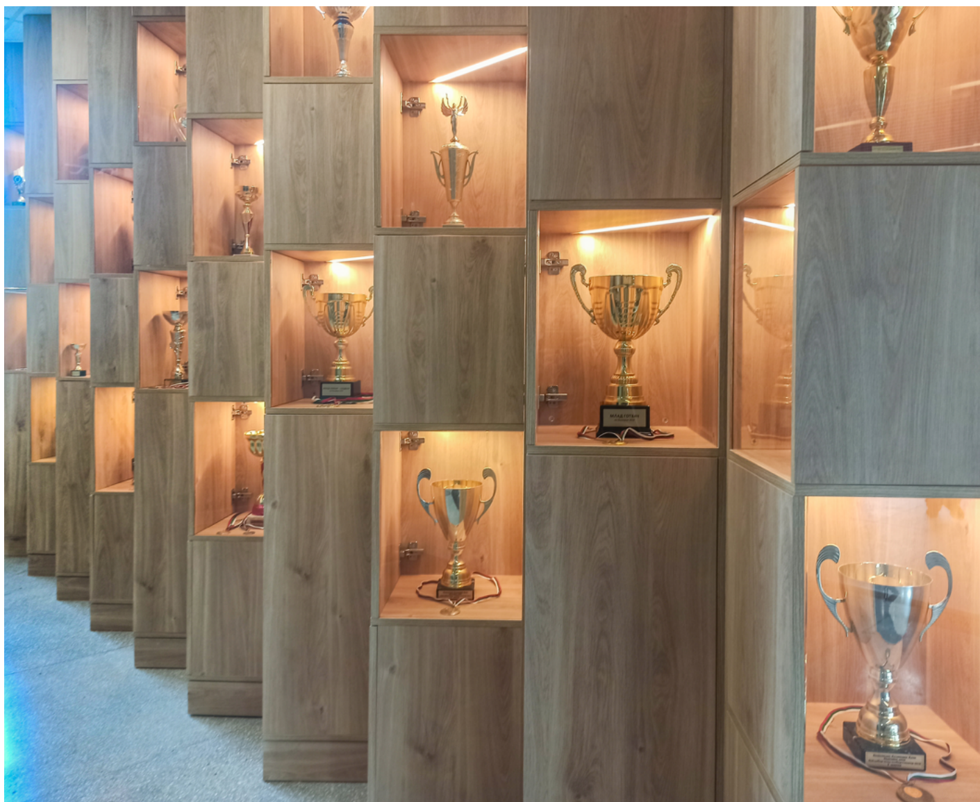
Част от отличията на учениците са изложени в обновеното фоайе на гимназията.